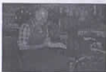
Den moderne, alstidige skomagermester (Ndr. Mern 1990)

"Landsbyen med de to gadekær", Nørre Mæhr 'ed &