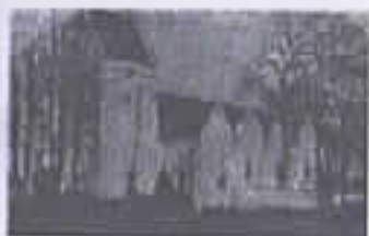
Mern Kirke foto 1915

Søndre Mæhr 'ed er skudt op på nord- og sydsiden af det store og engang sejlbare vandløb Mern Å. (Bynavnet Mæhr' skulle komme af myhr, der betyder mose, og mosebyen Myhr-Mæhr(h)en er med tiden blevet til, Mern).