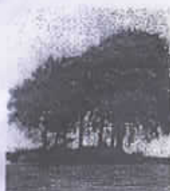
"Træhøjen" ved Tågeby - måske lå Merns sogns første kirke her...

Landhåndværkeren bliver slave - Tegning fra 12-hund-vedtallet, der forestiller nogle håndværk-bønder, samrydder og dyrker jorden. De bygger bjælkehuse men straks kommer herremanden, der tilbyder dem sin "beskyttelse", han udsteder fæstebreve, dvs. gør dem til "livegne"-fæstere igennem de næste 400-500 år.